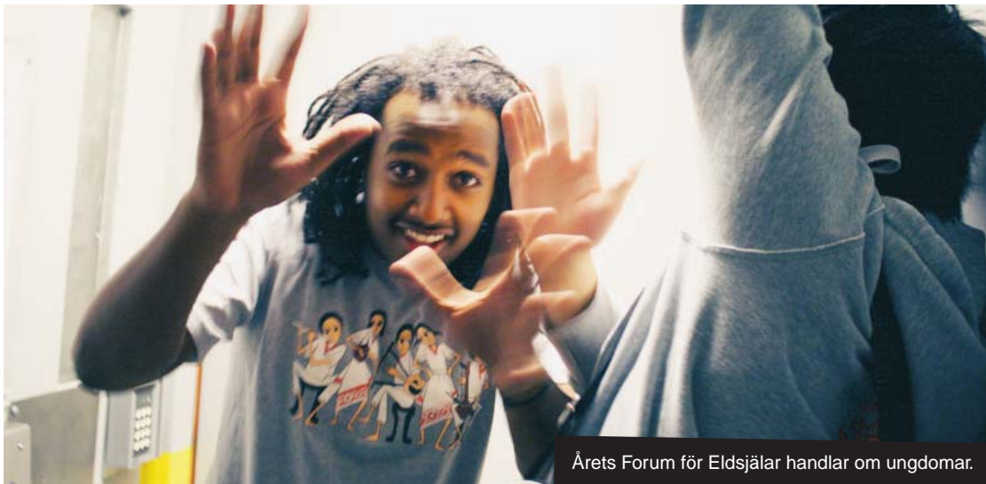
Årets Forum för Eldsjälar handlar om ungdomar.