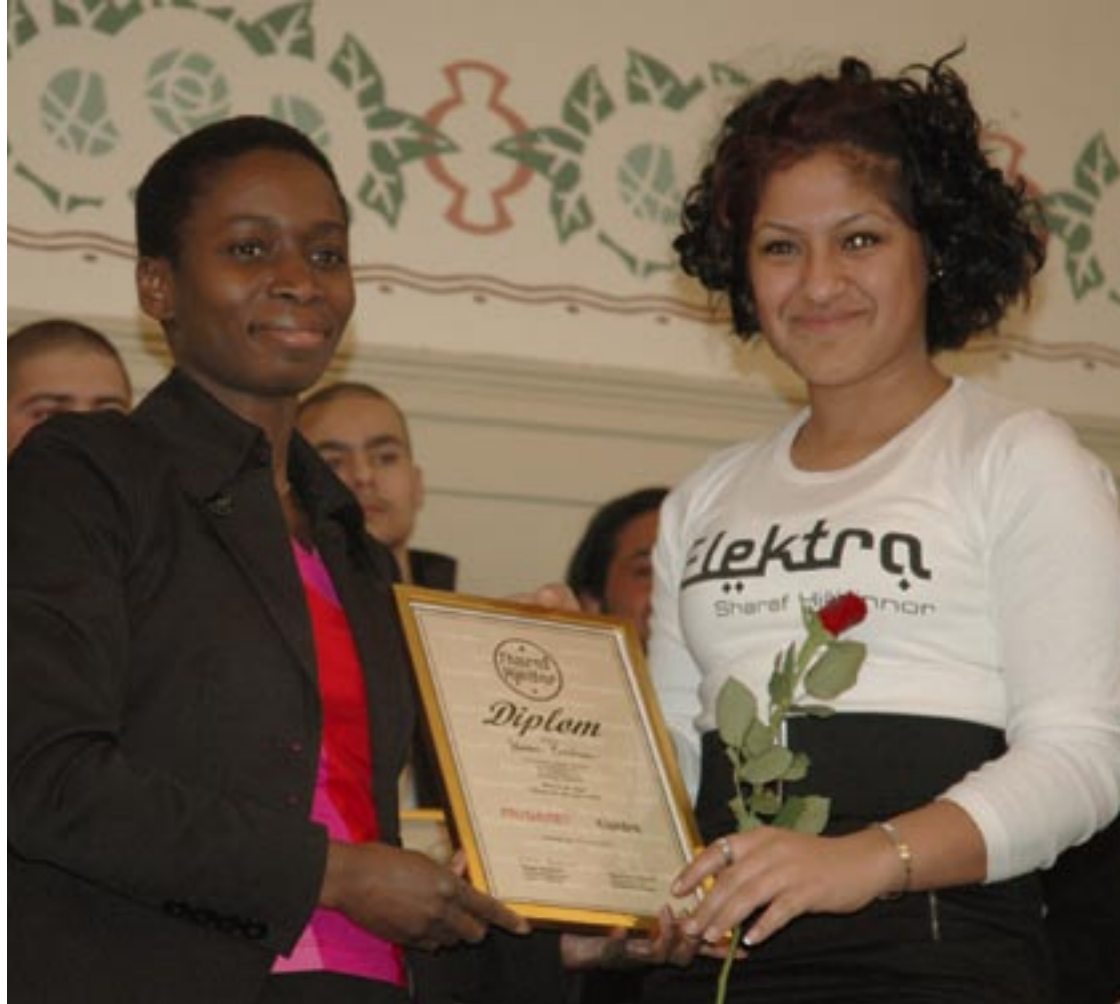
Sharaf hjältinnor diplomerar av ministern Nyamko Sabuni.