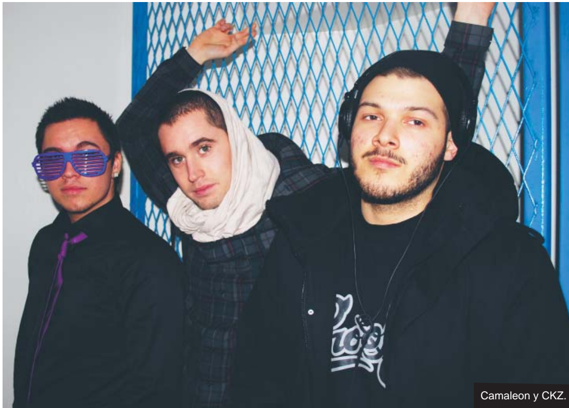
Camaleon y CKZ.

Hör gärna av dig till city@fryshuset.se om det vi skriver eller annat som du tycker, känner, vet eller tror. Fryshusets inslag i City finns också på www.fryshuset.se