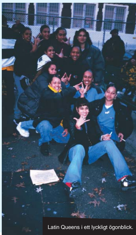
Latin Queens i ett lyckligt ögonblick.