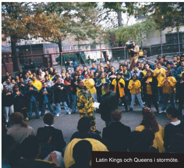
Latin Kings och Queens i stormöte.