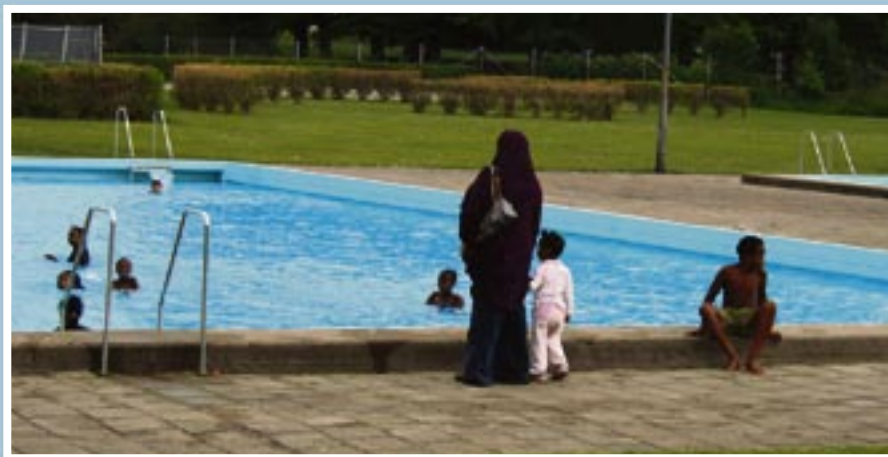
Kommunens mätningar har visat att Rosengårdsbadet har det renaste vattnet i stan.