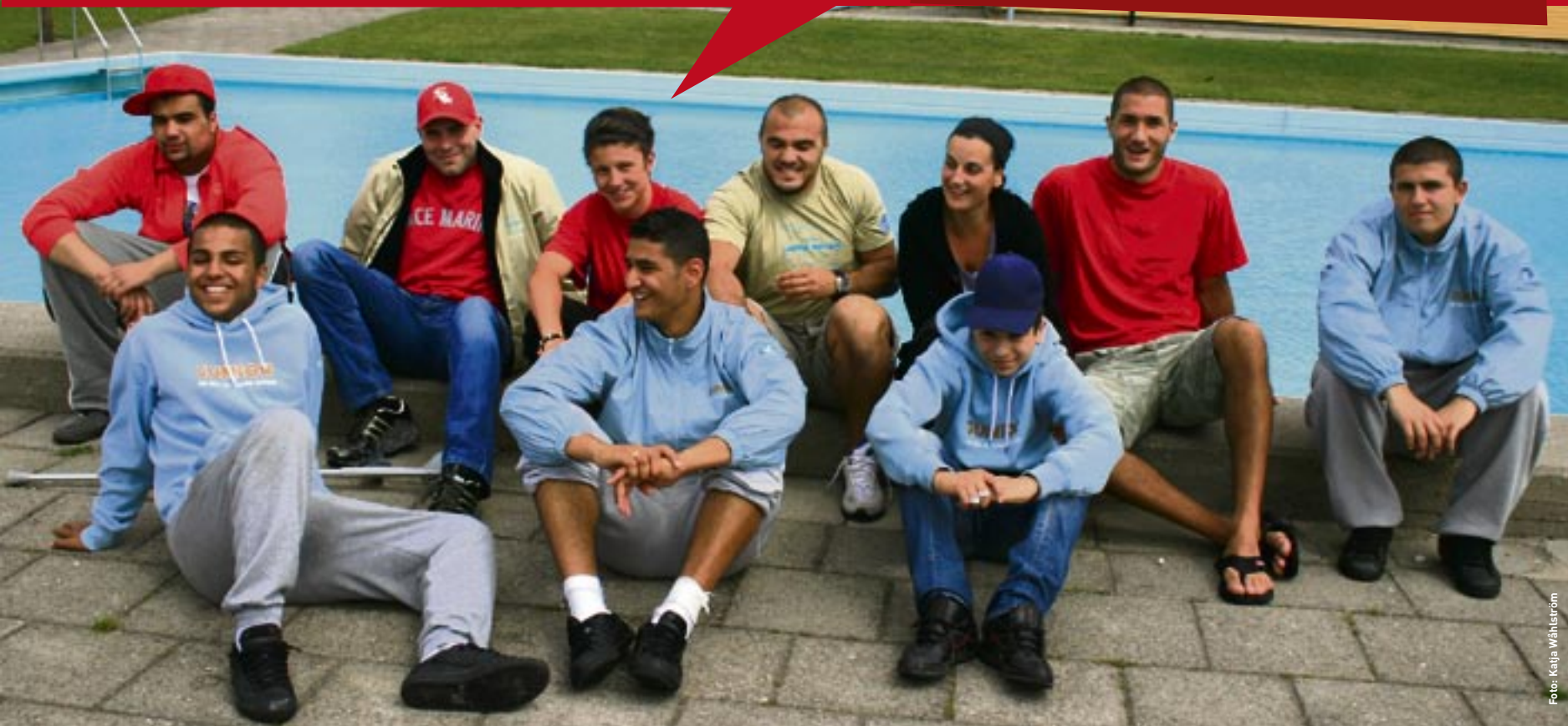
Lugna Gatan och ungdomarna som tog över Rosengårdsbadet, och som fick det att bli bästa badet i stan.