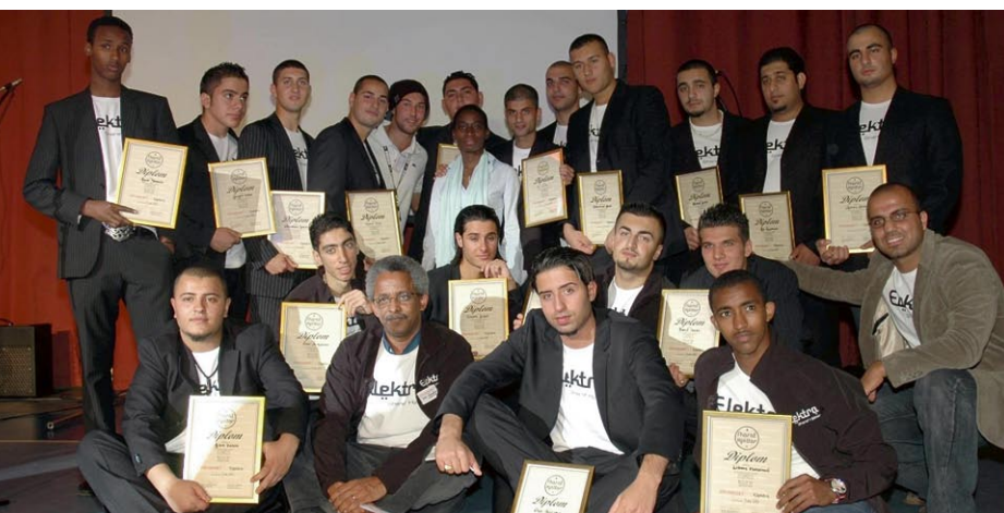
Malmö Sharaf hjältar tillsammans med integrationsminister Nyamko Sabuni.