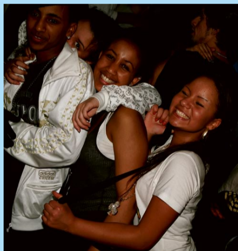
Lycika på dansgolvet...