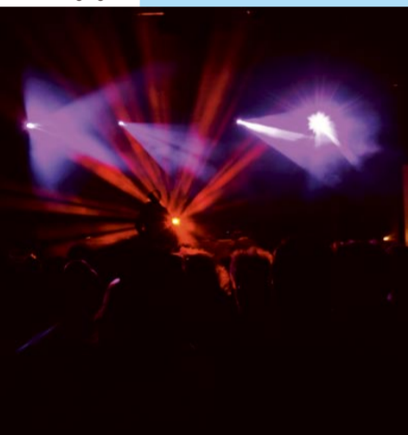
Malmö's Kårhus glittrade av ljus