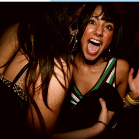
En av många glada...