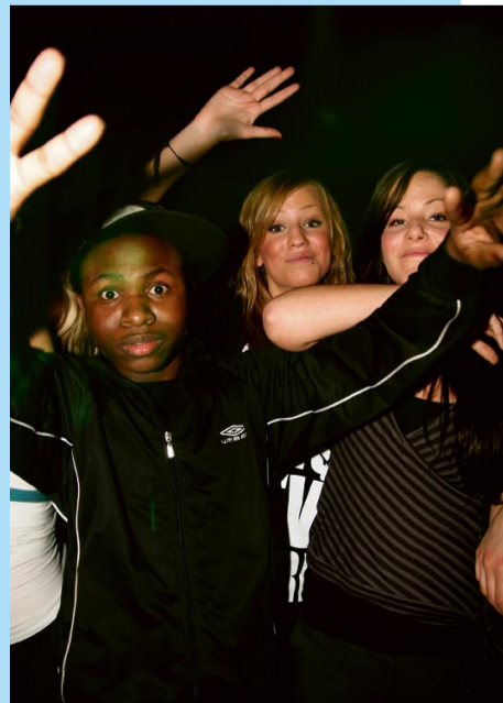
Glada ansikten på dansgolvet

FRYSHUSET är inte bara en mötesplats för många olika människor, det är också en idé som utgår från verksamheter inom Utbildning, Sociala projekt och Passionerade intressen. Fryshuset agerar där det finns behov. Vi är inte rädda för det som är nytt och okänt. Vi mobiliserar krafter där andra bara ser problem. Delar av våra verksamheter finns även i Göteborg, Malmö, Linköping och