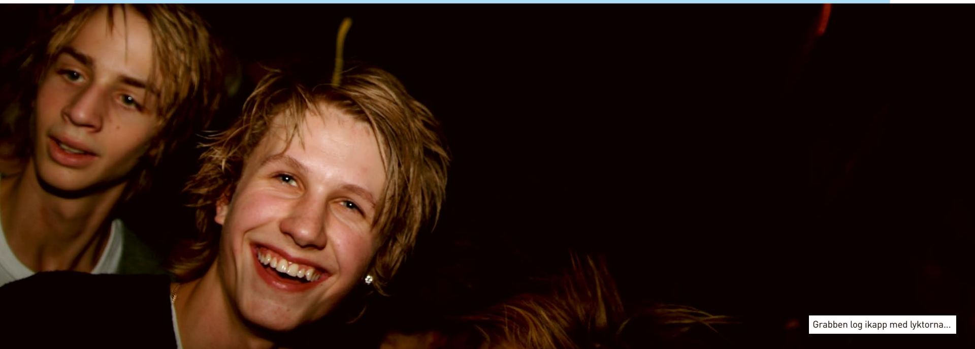
Grabben log ikapp med lyktorna...

VILL DU STÖDJA FRYSHUSET? GÅ IN PÅ WWW.FRYSHUSET.SE/STODFRYSHUSET