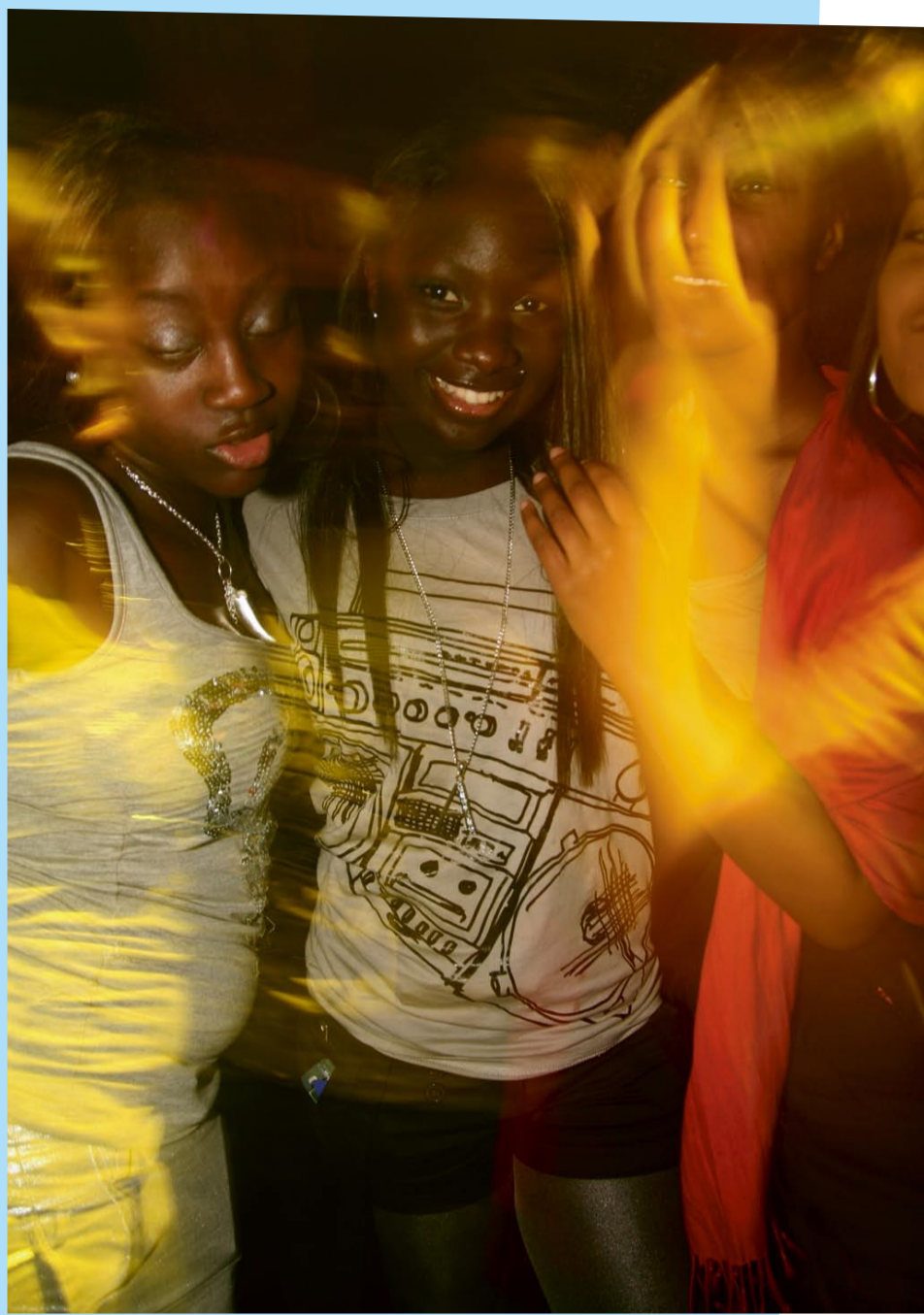
De dansade koncentrerat...